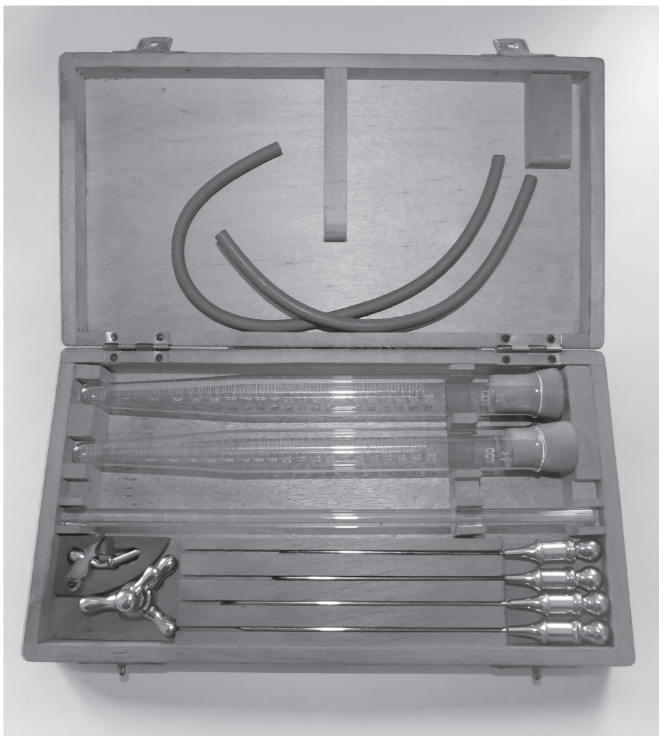
Obr. 2 Souprava pro lumbální punkci, Aesculap, 30. léta 20. století; Zdravotnické muzeum Národní lékařské knihovny, sign. N 533. Souprava obsahuje punkční jehly, kalibrované zkumavky se zahroceným dnem, spojovací hadičky, rourku k měření tlaku a trojcestný kohout.